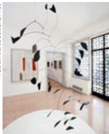
© Collezione Peggy Guggenheim, Venezia. Sala con l'opera di Alexander Calder 'Arco di petali' - 1941

pay-off "L'Arte ispira l'Impresa, l'Impresa fa vivere l'Arte". Se da una parte le aziende forniscono consulenza e sostegno, finanziario e in-kind, in favore della programmazione espositiva della Collezione e dei tanti progetti culturali, vengono proposti loro in cambio una serie di benefit quali, tra gli altri, la possibilità di utilizzare gli esclusivi spazi della Collezione per i propri eventi di corporate hospitality, occasio-